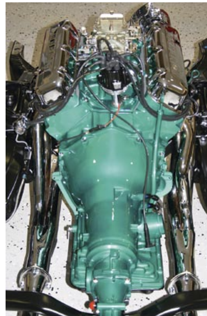
Motorpaketet lackat och monterat i det nyrenoverade chassit.