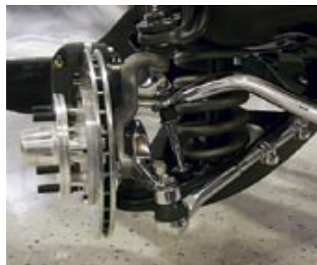
Nya styrstag har inhandlats och därefter doppats i krombadet. Krängningshämaren är original.