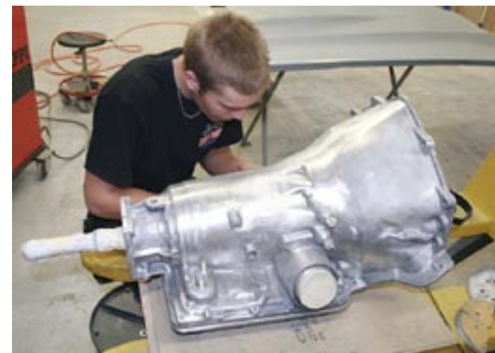
Automaten genomgår samma behandling som aluminiumtopparna. Efter nog-grann slipning grundas 700-lådan med epoxyfärg samt fillergrund.