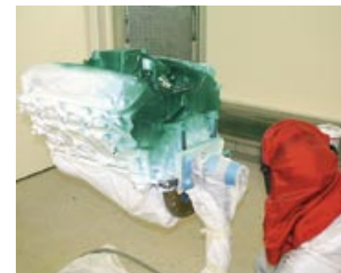
Grön pearl i samma nyans som karossen läggs över den vita basen. Det hela toppas sedan med flera lager klarlack.