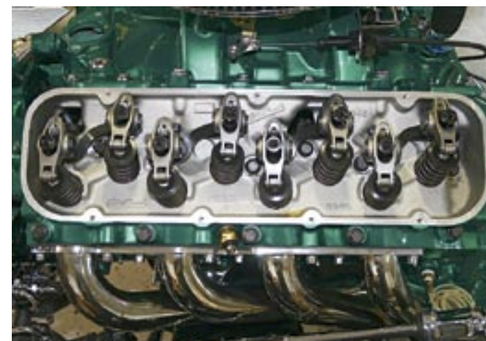
Aluminiumtopparna är Edelbrock RPM och försedda med rullvippor.