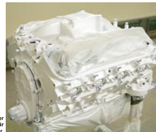
454-motorn grundad och slipad med 400-papper samt lackad i en vit basfärg. Insuget är vid det här steget löst monterat för att färg ska dimma innanför.