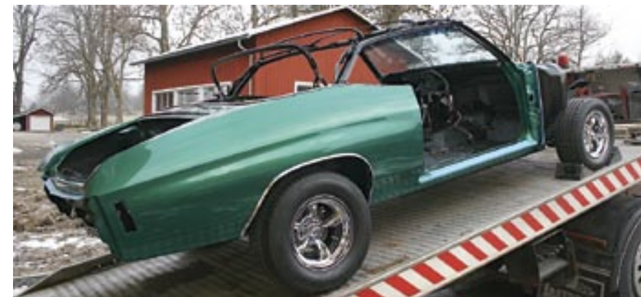
Så bär det iväg till sadel-makaren. I nästa nummer av BilSport Classic får ni följa med till CH Trimshop i Bodafors där Clarence och Christian Engborg förser Chevelen med ny in-redning och sufflett.