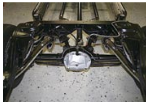
GM 12-bult med förstärkta drivaxlar pryder aktern. Tobba har monterat justerbara, övre bärramar samt en så kallad gripklo som ska hålla axeln på plats vid kraftigt gaspådrag.