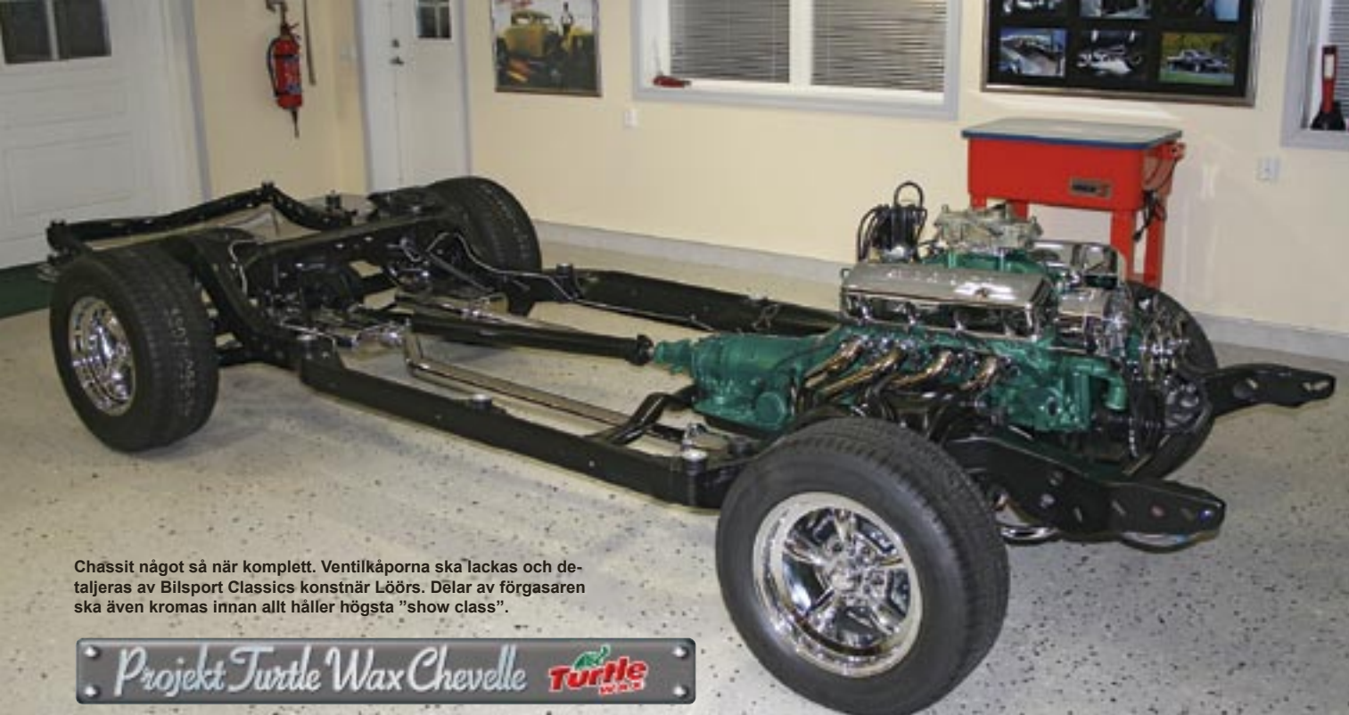
Chassit något så när komplett. Ventilåporna ska lackas och detaljeras av BilSport Classics konstnär Löörs. Delar av förgasaren ska även kromas innan allt håller högsta "show class".

P rojekt Turtle Chevelle handlar om en Cheva Chevelle Convertible -70 i slitet bruksskick som ska förvandlas till en show car lagom till Custom Motor Show på Elmia.