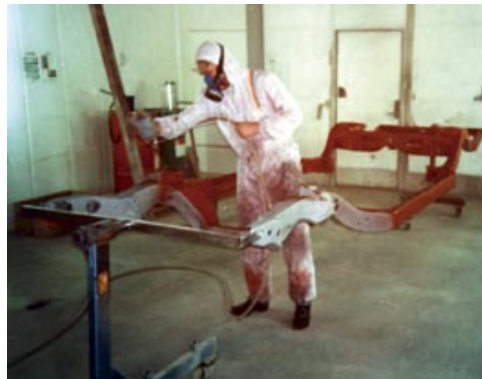
Ramen slipas, blästrats och grundas. Lackas sedan i en halvblank svart nyans.

Motorblocket slipas jämnt med olika trissor. Allt gjutskägg och alla