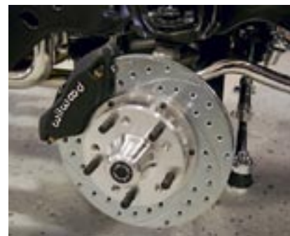
Skivor och 4-kolvsok från Wilwood pryder Chevellers framvagn. Bilens ursprungliga spindlar används för att få originalhöjd på Chevan.