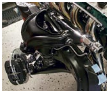
Chassit är en blandning av krom och svart färg. Även rattstängan har kromats.