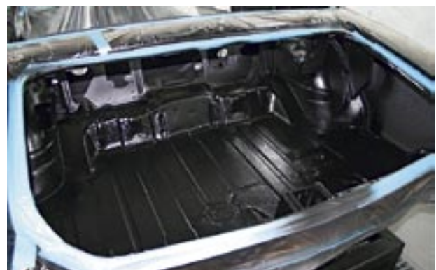
Före allting annat lackas bagageutrymmet. Första lagret över grundfärgen läggs med en halvblank, svart färg.