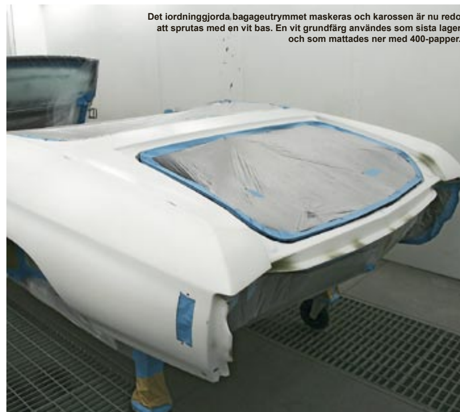
Det iordninggjorda bagageutrymmet maskeras och karossen är nu redo att sprutas med en vit bas. En vit grundfärg användes som sista lager och som mattades ner med 400-papper.