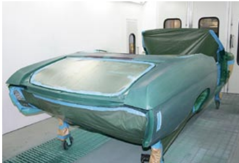
Nu är den första etappen avklarad. Karossen har sprutats i grön, specialblandad pärlemor. Därefter har den klarlackats och mellanslipats. Nu väntar ytterligare fyra varv med klarlack men först ska de svarta SS-fälten appliceras. Om man inte ska slipa och polera efteråt räcker det med två lager klarlack i sista omgången.