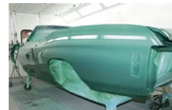
Innan den gröna pearlen ska appliceras monteras alla lösa delar provisoriskt. Detta för att ha koll så den tunna färgen blir jämnt fördelad på alla partier.