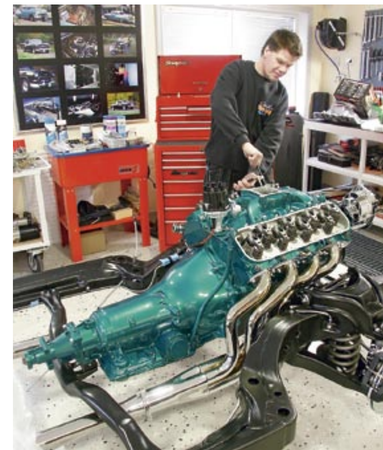
I nästa nummer får vi se hur chassi, motor och låda snyggas till.