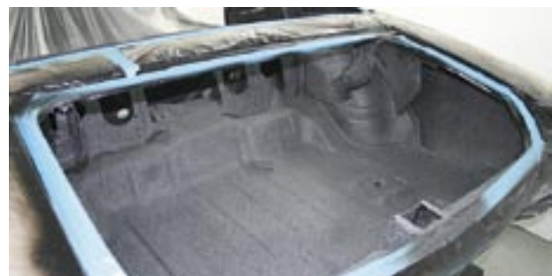
Bagageutrymmet färdigt. Det här blir faktiskt det enda på hela bilen som följer originalmönstret.