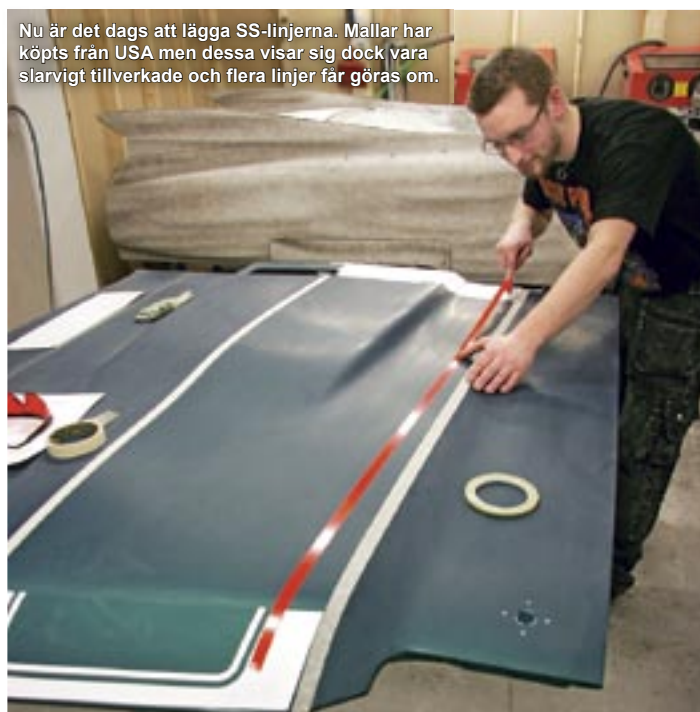
Nu är det dags att lägga SS-linjerna. Mallar har köpts från USA men dessa visar sig dock vara slarvigt tillverkade och flera linjer får göras om.

I nästa nummer av BilSport Classic visar vi vad som gjorts med chassi, motor och växellåda under tiden som karossen fått färg.