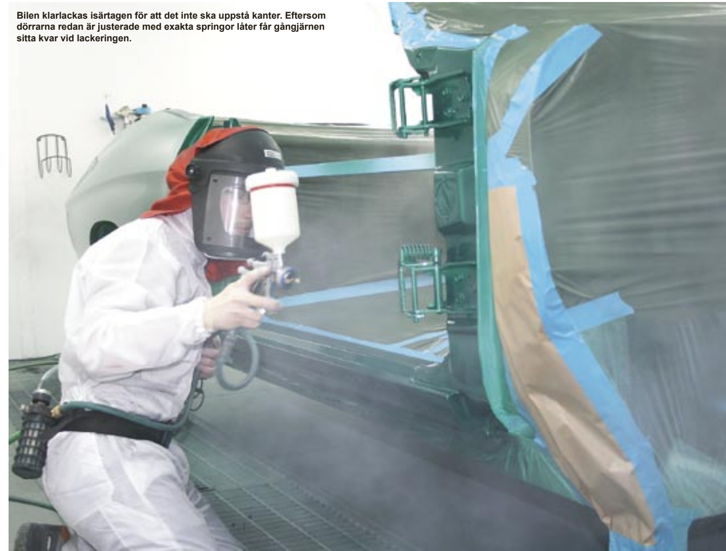
Bilen klarlackas isärtagen för att det inte ska uppstå kanter. Eftersom dörrarna redan är justerade med exakta springor låter får gångjärnen sitta kvar vid lackeringen.